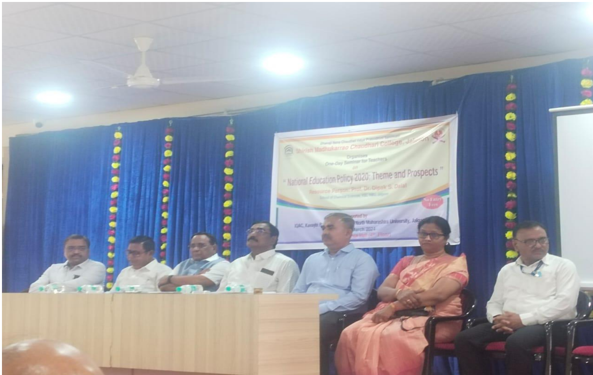
(NEP 2020 Conference participation DNC College,Jalgaon )