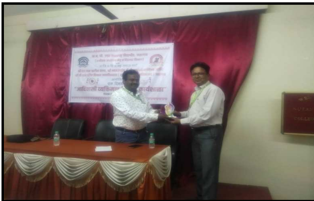
Adivasi Vyaktimatva Vikas Karyashala 6/02/2020