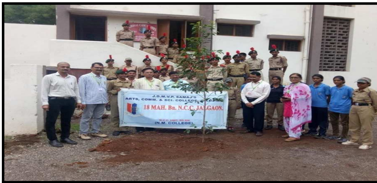
World Environment Day - Tree Plantation